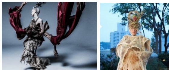
ARAKI SHIRO 氏の過去の衣装

手掛けたアーティストは、LADY GAGA/MISIA/ 柴咲コウ/蛭原友里/ゆず/小柳ゆき/永瀬正敏/ 乃木坂 46/櫻坂 46/Flower/Aimer など