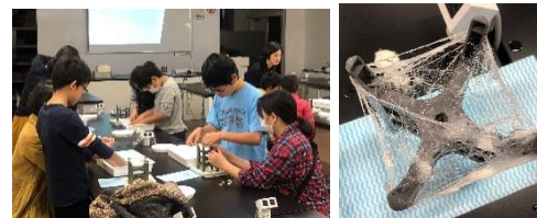
福岡市科学館のワークショップの様子