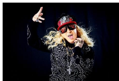
【出演決定ゲスト DJ】DJ K00