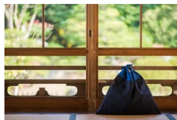
日本製の新しいエコバッグが テーマの「AZUMA」